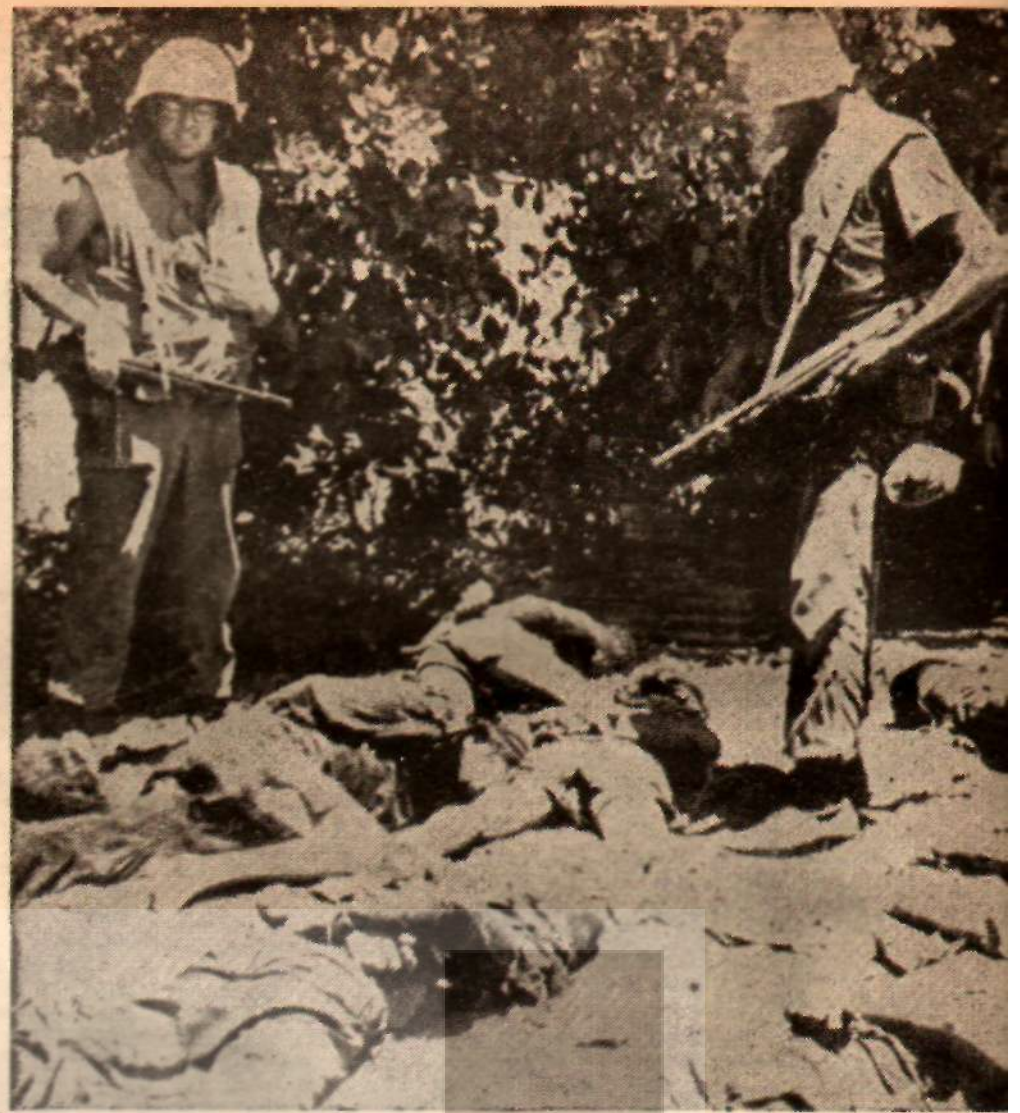
BİR DE GULUYORLAR: Güney Vietnam'da Amerikan Deniz Piyade leri önüne geleni «çeteci» sinda olan 61 Vietnamlı genç, kurşunlarla öldürülmüş. Deniz Piyade leri, kurbanlarının başı

Yine aşikârdır ki, Hintliler bu sefer Amerika'nın ölçülü bir harbe karşı olmayaca-